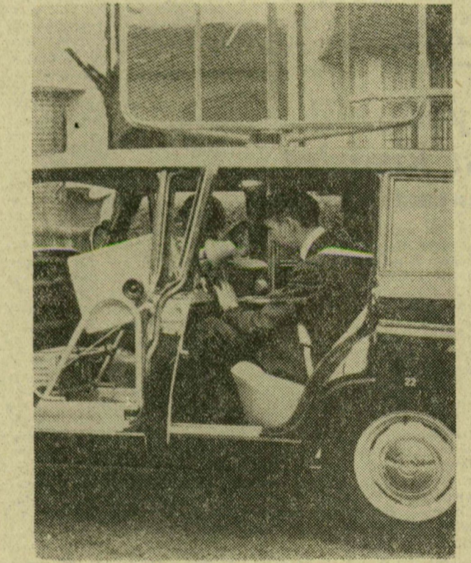
A tv-kutató gépkocsi, tetején a kereső antennával

kitölti a vevőkészülék: bejelentő nyomtatványát. D. Gy.