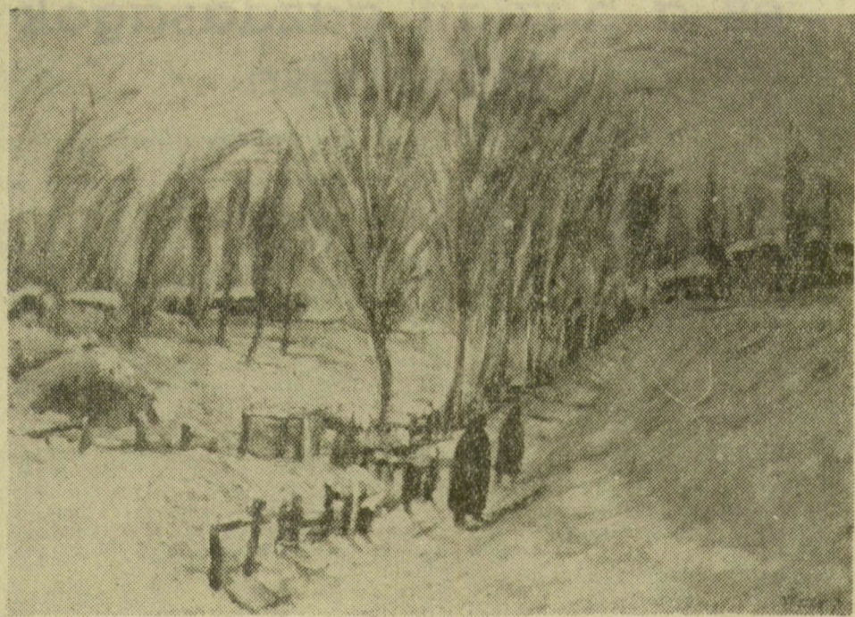
A művész Téli táj című festménye a műtermi kiállítás anyagából

Mielőtt ismét elindulna a hazai tájak és kisvárosok Bajai irányába húzódó vonalán, műtermének falain a közönség elé tárja múlt évben létrehozott alkotásait. Ezeknek nagy száma és változatos arculata a művész szorgos tevékenységét dicséri, aki az általa megfigyelt élet- és természetképeket sokszínű örökítette meg.