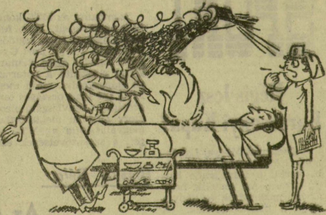
— Doktor úr, elfelejtettem megmondani, hogy a páciens cirkuzi tüzncelő...

A könyvkülönlegességek kedvelőinek kedves meglepetéssel szolgált a Kossuth Könyvkiadó és a Magyar Helikon. Alig gyűlésskatulyányi, kb. 4x5 centis méretben adta ki a Kommunista Kiáltványt. Marx és Engels e világhírű művét sőt a vörös bőrkötésben, színes tokban vehetik kezükbe az olvasók. Az izléses, különleges kis könyvecskeben a Kommunista Kiáltvány teljes szövege megtalálható — az 1848. február végén Londonban megjelent első kiadás nyomán készült fordításban —, valamint tartalmazza Engelsnek a későbbi kiadásokhoz írt jegyzetét is.