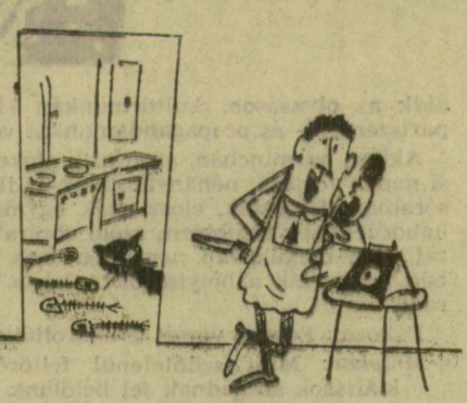
... Most pedig mond meg drágám, hogyan kell megsütni a halat? (R. Ovján rajza)