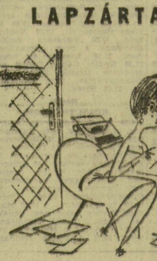
(Tócsa Tibor rajza.)