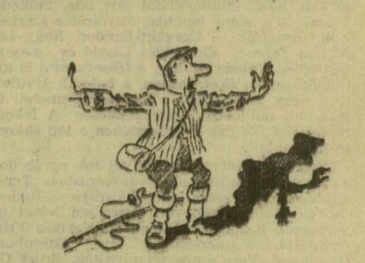
Ha az árnyékunk nem tudna beszélni... (R. Ovján rajza)