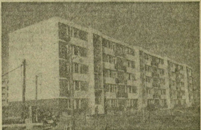
Az Ogyessza negyed új, 74 lakásos épülete