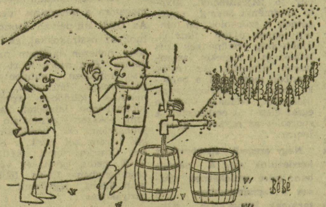
Balogh Bertalan rajza