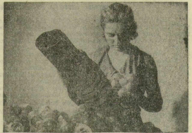
Munkában a töltőberendezés

Jól fizet az idén a vöröshagyma a szegedi járás tiszántúli vidékén. Deszkről és a környékbeli tsz-ekből sok vagon termést szállítanak a MEK kiscsombori telepére, ahol exportra előkészítik a vöröshagymát. A kis szákokat pillanatok alatt telítik a hurkatöltőszerű »hagymaágyúk«.