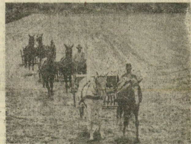
Egymást követve dolgoznak a fogatok