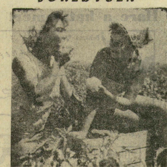
A szövetkezetekben vidáman dolgoznak a lányok is, s izlik a kis szünetben a szüretelt cecei paprika.