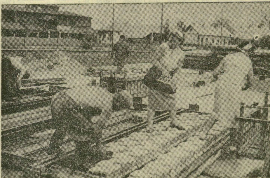
Formába rakják az üregek téglát