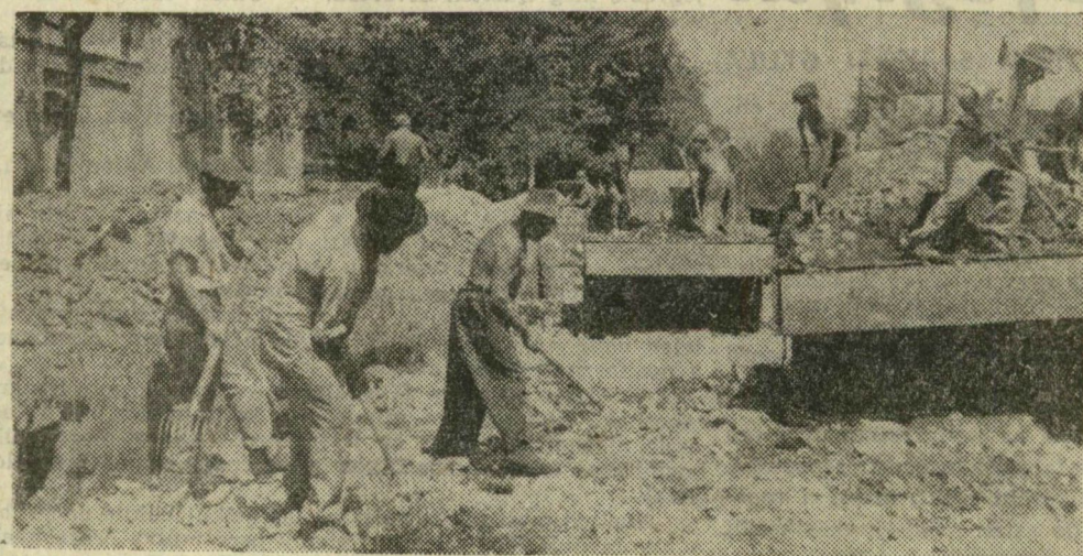
A tűző nap sem hátráltatta az útépitők munkáját a Szilléri sugárúton