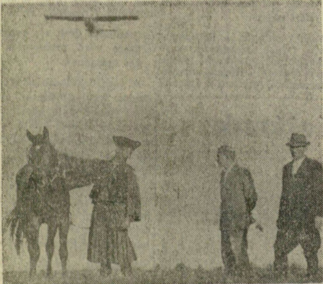
A pusztán nem ritka a régi ruhába öltözött csikós és a modern mezőgazdasági repülőgép találkozása