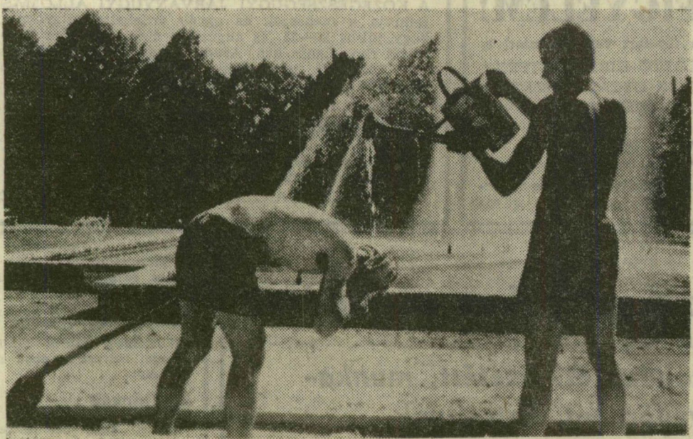
A Móra-park sétányán dolgozók egy kanna hideg vízzel hűtik egymást