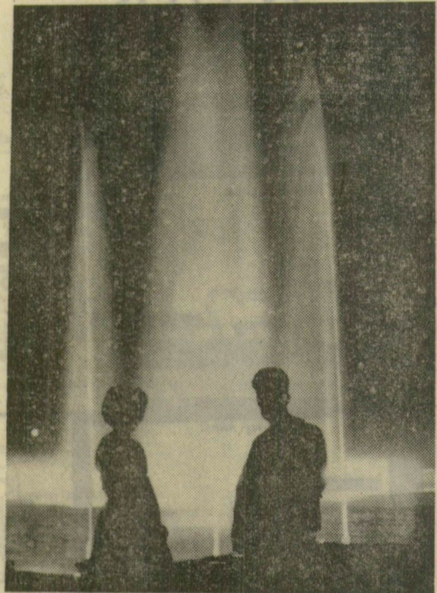
Este az új szökőkútjánál a szegedi Móra parkban

KÜTI Árpád: Csomagolt tökehús az önkiszolgáló boltokban. Kirakat , 1963. július. [A Szegedi Elelmiszerkiskereskedelmi Vállalat kísérlete.] CSERHALMI Imre: Szeged 1963. A napfény városa. Népszabadság , július 14. [Wormser Antal képeivel.] LOVÁSZI Ferenc: Pillantás a sebészet jövőjébe. Dr. Petri Gábor professzor a műtéli eljárások fejlődéséről. Népszabadság , júl. 16. Tizennygy külföldi futó a szegedi maratoni versenyen. Népszabadság , júl. 17. A Szentivánéji álom szegedi bemutatójának előkészületei. Népszabadság , júl. 7. [GÁL Zsuzsa] (G. Zs.): Új szállodák. Népszava , júl. 17. [A Tisza Szállóról is.] [DALOS László] d. l.: Tóth Béla: Atya, fiú, szentlélek. Ország-Világ , júl. 17. [Ismeretetés.]