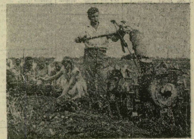
Szedik a virághagymát a földből

A virágmag termesztéséről híres szeged-mihályteleki Új Élet Termelőszövetkezet bodomi üzeme-gységében szüretelik a tulipánhagymákat. Tíz holdról mintegy három-millió darabot szednek fel, s megfelelő válogatás után ország-szerte szállítják majd az őszi hónapokban. Ezenkí-vül jelentős mennyiséget exportálnak nyugati államok-ba és a Szovjetunióba.