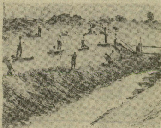
Dolgoznak a 2800 méteres csatorna egyik szakaszán

A Csongrád Megyei Építőipari Vállalat 4-es számú főépítészvezetőségének irányításával nagy ütemben készül a hattystelepi vízátemelőmű csatornája. A nagyszabású építkezések most a második szakaszán dolgoz-