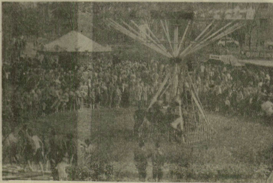
Csúcsforgalom Újszegeden, a forgóhíntánál

Egész nap özönlött az emberfolyam át a hídon a ligetbe, ahol már a kora déli órákban megkezdődött a majális. A gyűlés után szinte perceik alatt elözönlötték az emberek a liget sétányait, körülülték a vendéglők, a Vigadó asztalait. Délelőtt már valóságos közharcot kellett vívni egy-egy ülőkialmatosságért a szórakozóhelyeken.