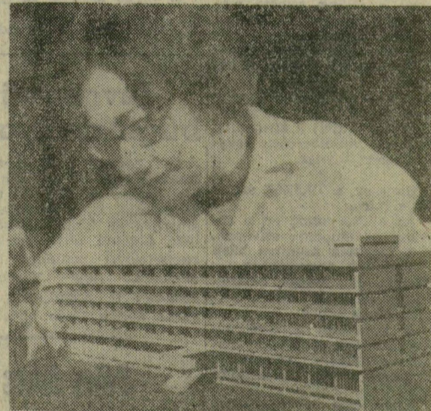
Budapest legszebb részén, a Rózsadombon ifjúsági szállodát építenek. A négyszáz ágyas szállodában — melyet az Expressz Ifjúsági Utazási Iroda kezel — 400 vendégnek tudnak majd kényelmes szállást biztosítani. Az épület még az idén elkészül, építkezési költsége 18 millió forint