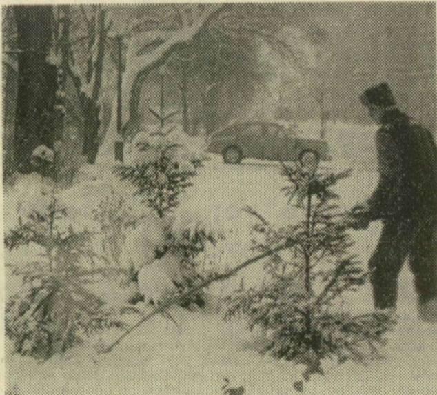
A parkok gyenge fenyőit megvédik a hó kártevésétől: ágairól leverik a havat a kertészeti vállalat munkásai