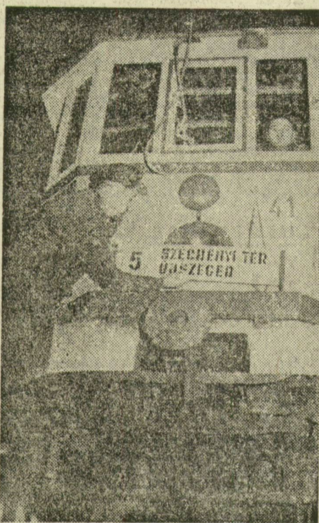
EZ A KÖVETKEZŐ. Január 15-én minden régi kocsit bevonnak az újszegedi vonalról.

A vállalat műhelyében ezen kívül több régi kocsit fiatalítanak meg, újítanak fel. A szegediek egy korszerűen átalakított