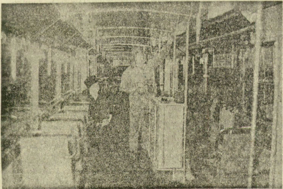
AZ UTOLSÓ SIMÍTÁSOK... És rövidesen a második csuklós villamos is útnak indul Szegeden