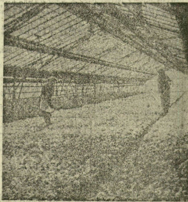
Különböző fajta külföldi salátával kísérleteznek ebben az üvegházban. A legjobb fajtákból tavaszi primőr áru lesz a szegedi üzletekben.

Télen a fagyos földeken zaiba belép — mintha egy szünetet a munka, zúzmara, szerre más éghajlat alá érő hó borítja a talajt mindeközben — párás melegben nőtt. A télkabátos látogató, nyíló virágok, zöldellő saláták — az újszegedi Haladás-fejek látványában gyönyör-Termelőségüket üvegház-ködhöz.