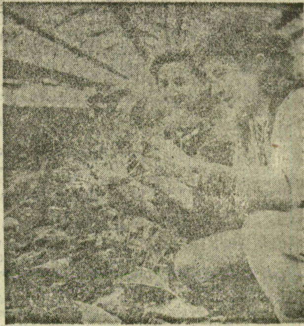
Nyolcvanezer karalábé felel a második üvegházban. Naponta locsolják, méregtelenítik, és ha eléri a kívánt nagyságot, exportára lesz belőle.