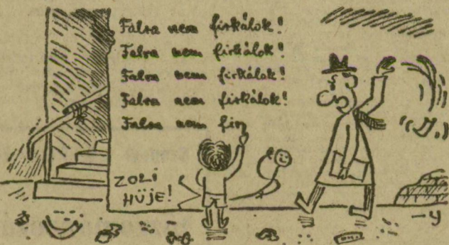
(Kerecsy Sándor rajza)