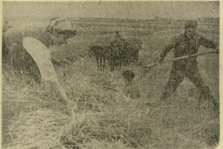
Mintha július volna. Jó kurjantásra magasodnak egymástól az asztagok, s a kéverakásban segítenek a szövetkezet asszonyai is.