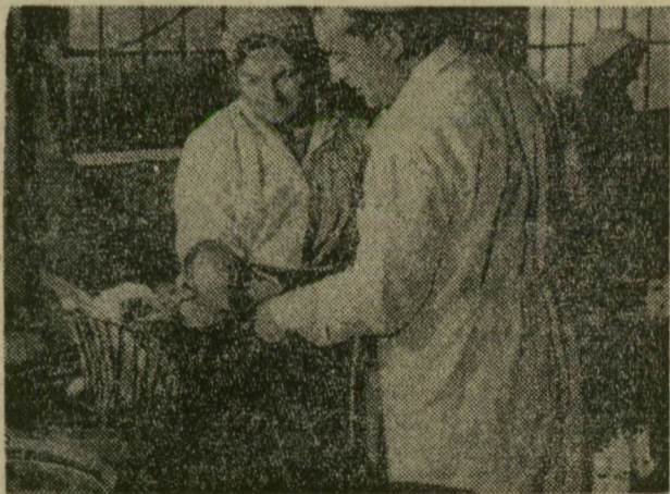
Hordókból kicmelik a halakat

A Szegedi Konzervgyárban megkezdődött az őszi hagyományos halászlékészítési idény. A közkezdvelt szegedi ételkülönlegességet eredeti halászmódra készítik azzal a különbséggel, hogy nem bográcsban, hanem hatalmas üstökben főzik, majd dobozokba töltik. Egy dobozba húsz deka halhús és ugyanennyi lé kerül. Egyelőre tíz vagon fehértói tükrös és pikkelyes pontyot dolgoznak fel. Később, a téli hónapokban valószínűleg újabb idény lesz.