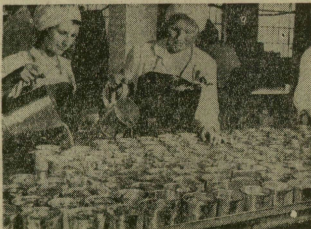
Dobozokba töltik a halét