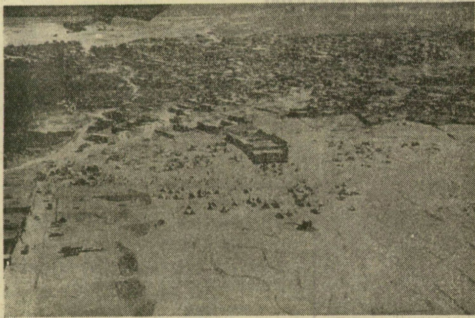
Dan Estaban környékén az életben maradt lakosság sátrakban búzza meg marát