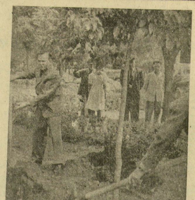
Szeged és Ogyszsa, a két testvérváros barátságának jelképeként a szegedi párt- és tanácsi delegációt látogató elvtársak a pártbizottság székháza melletti parkban. Úgy erősödjön, virágozzon és gyümölcsözőn a két város dolgozóinak barátsága, miként ez az elültetett fiatal fa!... Képünk az ültetés perceiben készült

TÖBBFELÉ tapasztaltuk, hogy üzemekben, iskolákban kitűnően felhasználják a barátság ápolására a szegedi sarkokat, amelyekben szegedi képek, könyvek, emléktárgyak ismertetik városunkat. Időnként itt megemlékezéseket, előadásokat tartanak. A barátság ápolásának ezt a formáját nálunk is általánosabbá kívánjuk tenni. Ugyancsak bővíteni kívánjuk a levelező kapcsolatokat az ogyszai és szegedi dolgozók, úttörők között. Sokat tanultunk az ogyszai elvtársainktól. Sok érdekes tapasztalatot szereztünk pártmunkájukból. Egyebek között azt tapasztaltuk, hogy mindinkább a pártmunka operatívitásának fokozására törekszenek. Ott tartózkodásunk napjaiban például az újságokban és párt fórumokon a felesleges értekezletek elhagyására hívták fel a figyelmet. Idéztek Dzerzsinszkij elvtárs tanácsát, aki annak idején