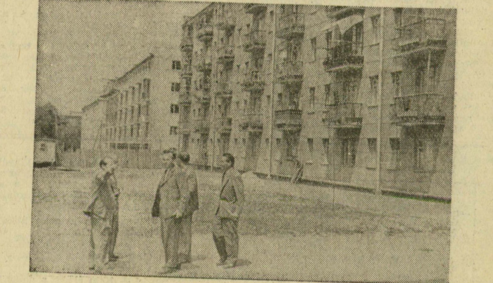
Ogyszsa egyik legszebb, most épülő új sugárútja viseli Szeged nevét. Képünk: részlet a Szegedszajáról