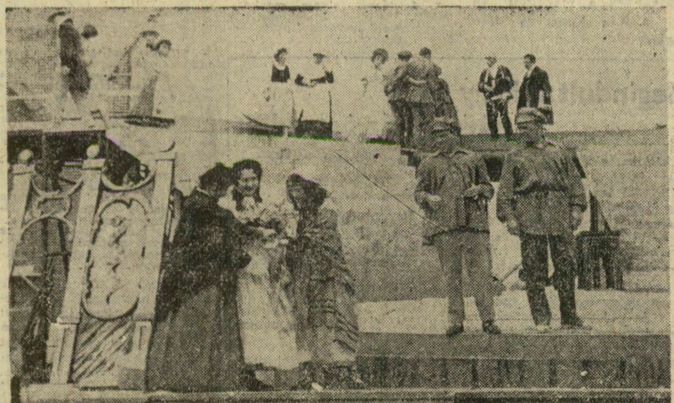
A próba egy jelenete a londoni színből, immár a Szegedi Szabadtéri Játékok színpadán