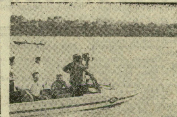
A Szegeden tartózkodó filmesek csak késve értesültek a hajóútról. Így a rendőrségi motorcsónakkal érték a bajó után, hogy néhány kedves képsort megörökítsenek