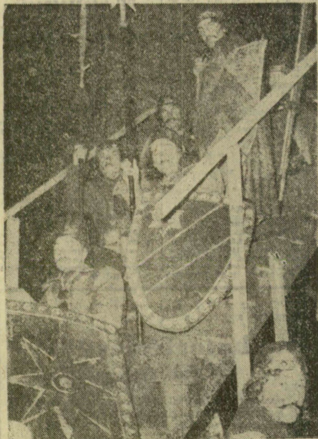
„Páncélban”, „vértben” jelenésre vár a színpad mögött a Hunyadi László statisztériája