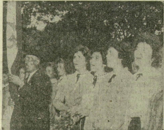
Fiatlók és idősek együtt daloltak vasárnap reggel a Széchenyi téren a kórusok zászalát alatt

tömegű kórusokra van szükség, hanem azért is, mert ezek az alkotások igen szoros kapcsolatban vannak a mondanivalóval, illetve éppen azt fejezték ki, amit a felszabadulás mindannyiunk számára jelent. Ilyenformán ez a hangverseny, amellyel méltón nyitotta meg a dalostalálkozót, egyben a felszabadulási kulturális seregszemle utolsó kiemelkedő zenei eseménye és a szegedi ünnepi hetek nyitása is joggal lehetett.