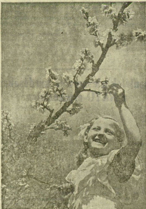
VIRÁGZIK AZ ÓSZIBARACK.

Kedden délelőtt Budapesten, a Technika Házában megkezdődött a Magyar Hidrológiai Társaság és a Vizgázdálkodási Tudományos Kutató Intézet kétnapos ankétja. Az ankétot a Magyar Tudományos Akadémia, az Országos Vízügyi Főigazgatóság, az egyetem, a kutatóintézetek és a vállalatok kutatói és vezető szakemberei vitatják meg a hazai vizgázdálkodási tudományos kutatás jelenlegi helyzetét és fejlődését, valamint a kutatás tővábbi feladatait.