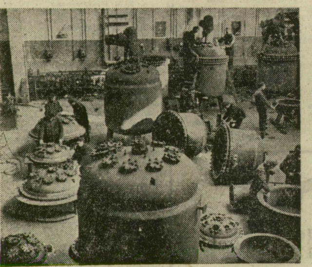
A Budapesti Zománcipari Művekben új szerelőcsarnokot helyeztek üzembe a LAMPART márkájú, savállóan zománcozott vegyipari gépek gyártásához. Felvételünkön az új műhely egy részlete látható.

A szovjet kormányfő ma Burmába utazik. Elutazása előtt közös közleményt adnak ki Hruscsov és az indiai vezetők megbeszéléséről.