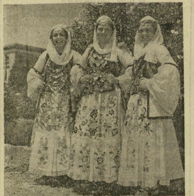
Az albán nép felszabadulásának 15. évfordulóját ünnepli a napokban. E nagy jelentőségű jubileumra országszerte változatos, színes műsorokkal készültek a kulturális csoportok. Felvételünkön a tiranai kulturális seregszemlén résztvevő egyik táncgyűjtés három bájos tagját láthatjuk arziroksztrói, dél-albániai népviseletben.

— De a főbb irányvonalak már megvannak, azokról beszélhetek. Az országos irányelvek szerint a pamutszövödék kapacitását 26—28 szá-