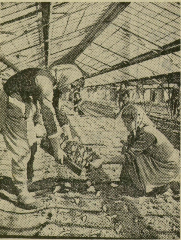
Palántálják a salátát a melegvízfűtéses üvegházakban.