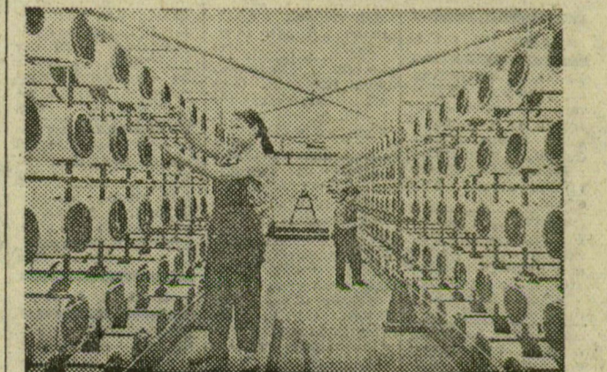
A relon nevű műszai sokféle áru előállítására alkalmas. A Savinest-i műanyaggyárban — amelynek egyik üzeme részét látható képünkön — készítik.

Csak a felszabadulás után badulás óta eltelt másfél évtized alatt a gazdag természeti kincsek nyújtotta lehetőségekre épült román ipar az 1938-as mennyiség három és félszeresét termeli általában. Amíg 1938-ban az ipar a nemzeti jövedelemnek csak a 26 százalékát szolgáltatta,