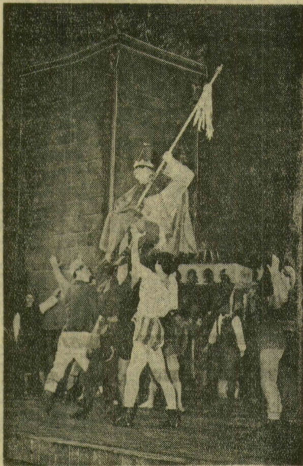
A bolondok pápájának megválasztása — jelenet az I. felvonásból.