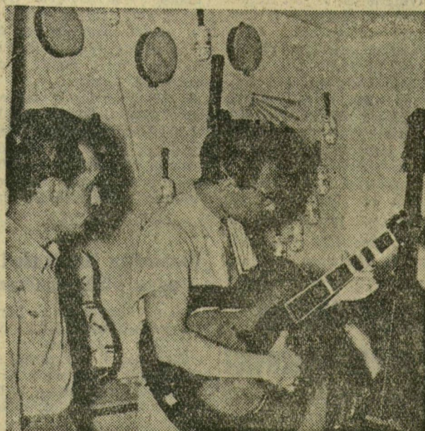
A Hangszerkészítő Vállalat díjnyertes pavilonjában hangszerpróbát tartanak.

dolgozó és Finommechanikai Vállalat. Az üzemek közül elismerő oklevelet kapott a Szegedi Falemezgyár és a Szegedi Nyomda Vállalat.