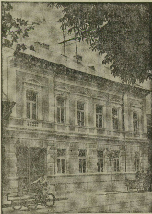
Rohamosan szépül Szeged. Egymásután hozzák rendbe az elhanyagolt házakat. Így történt ez a Toibuhin sugárút 22. számú háznál is. A rozoga ház elcsúfította a környék képét. Az Ingatlankezelő Vállalat felújító részlege komoly, nehéz munkával, 500 ezer forintot költséggel rendbehozta a házat, s annak lakásait. Képünk az újjávarázsolt házat ábrázolja.