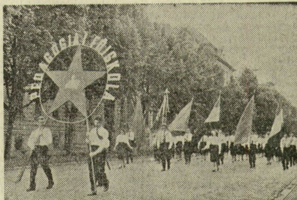
Fehér inges kisziták nyitották meg a Főiskola szép felvonulását