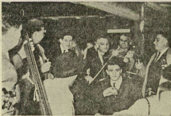
Vidám szórakozás a kenderfonógyári sátorban Újszegeden

Több helyen — mint a szakszervezeti székházban, vagy akarta tudomásul venni, hogy május elseje van, az emberek azonban ragaszkodtak az ünnephez, a vidámsághoz. Az éttermek bábéli zsvajában válogathatott az ember tánczenét, hallgató dalt, vagy jó, hangos május kurjongatást, miközben az utcán ballagtak hazafelé, akik kidőlték. A járdán fényes foltokban tavacsok csillogtak. Az emberek ke-rülgették őket jobbra-balra. De volt aki hiába kerülte, két lépés, egy loccsanás... és aztán egy lépés, két loccsanás... A két loccsanás leginkább azokkal fordult elő, akik már amúgy is el-áztak.