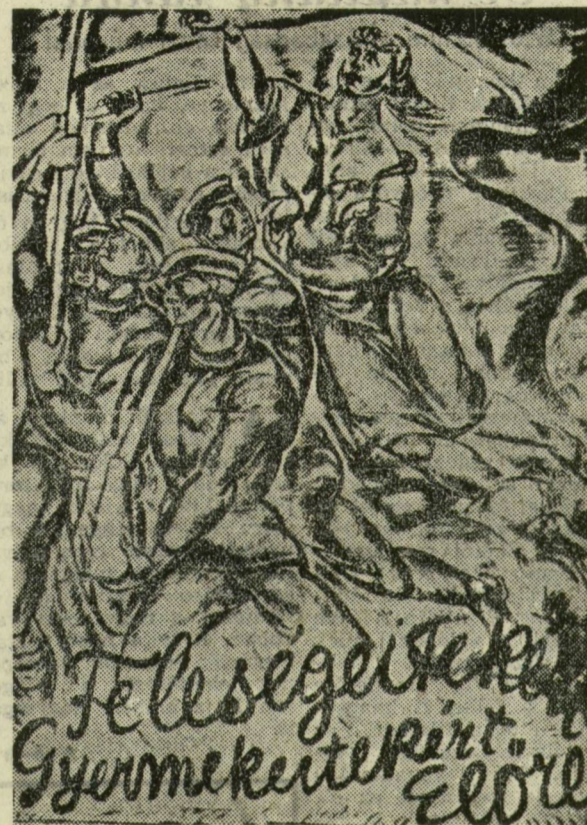
Pör Bertalan: Feleségeitekért, Gyermekeitekért Előre!