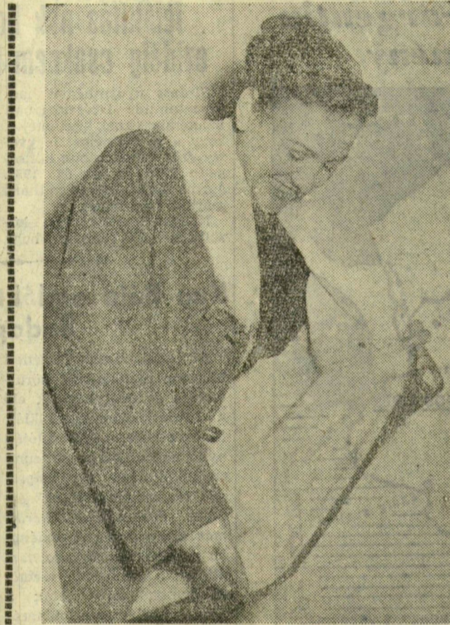
(Liebmann Béla felv.)

A tapasztalatok szerint az utóbbi hónapokban a szegedi textilipari üzemekben nem kielégítő az üzemi tanácsok munkája. Erre felhívva, a Textilipari Dolgozók Szakszervezetének Csongrád megyei területi bizottsága brigádokat küldött ki a két legnagyobb szegedi textilüzembe, az Újszegedi Kender- és Lenszövénygyárba, valamint a Szegedi Kender-