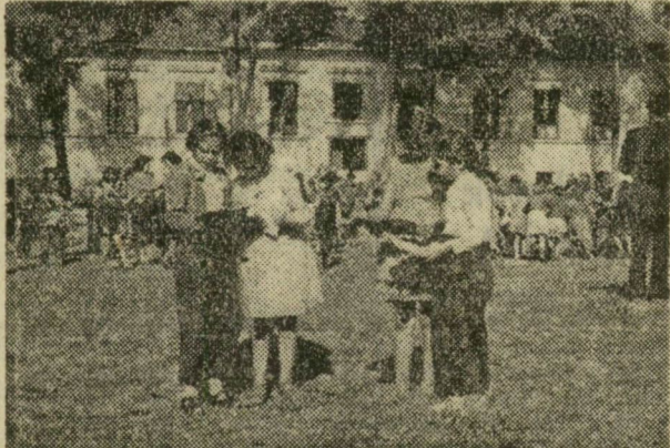
Sok száz kisdíák tanul a sándorfalvi kastélyban, amelynek küszöbét annak idején parasztember nem léphette át. Képvén a gyerekek vidáman töltik az órák közti tízperces szünetet.