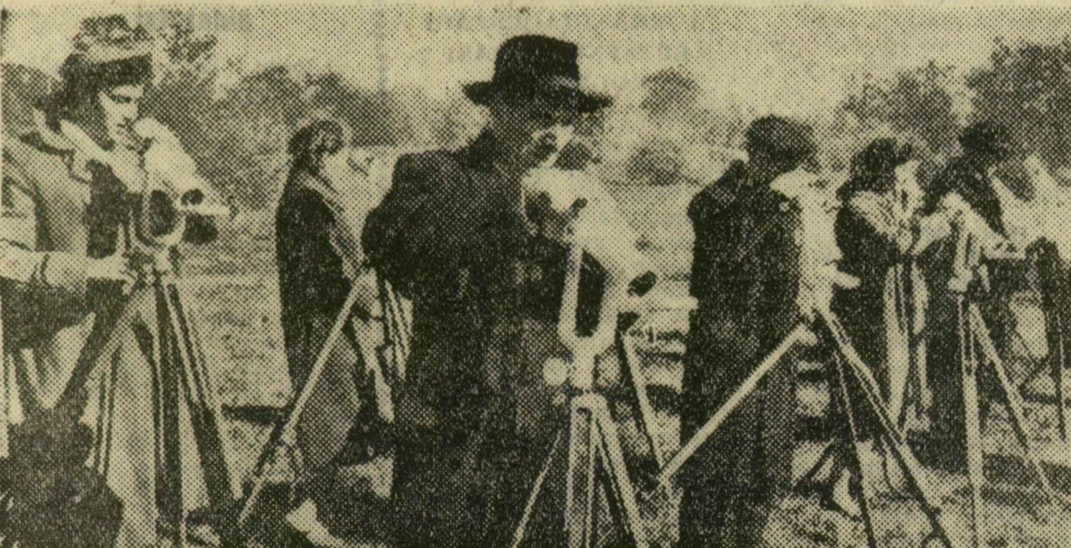
Ma egy esztendeje kelt szárnyra a szovjet tudományos élet páratlan világszenzációt jelentő eseményének híre: az első műhold felbocsátásáról. Az évfordulóról lapunk 3. oldalán emlékezünk meg. Képünkön az Ukrán Tudományos Akadémia kijevi obszervatóriumának munkatársai figyelik a szaturnus útját