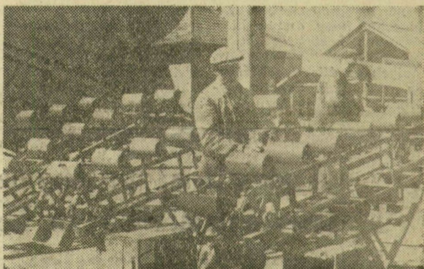
A lecsipedett, hasított paprika az idén felújított és korszerűsített szeletelő gépekre kerül. Itt vágják fel apróra a paprikát, ezáltal sokkal gyorsabban párolog el belőle a nedvesség, hamarabb kerülhet további feldolgozásra, majd a külföldi és hazai piacokra.