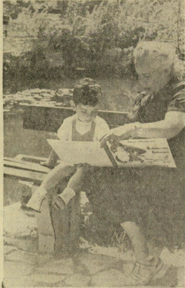
— Jó reggelt, kisgyerek, reggeliztél már? Na, akkor ülj le szépen a padra és nézzük végig Miska macska csodálatos kalandjait!

Ulan Batorban a Dund Gol folyón épül Mongólia legnagyobb hídja. A híd hossza több mint 370 méter lesz, szélessége akkora, hogy egymás mellett egyszerre négy teherautó haladhat át rajta. Eddig az építkezési munkálatok 60 százalékát fejezték be és az év végére a hidat átadják a forgalomnak.