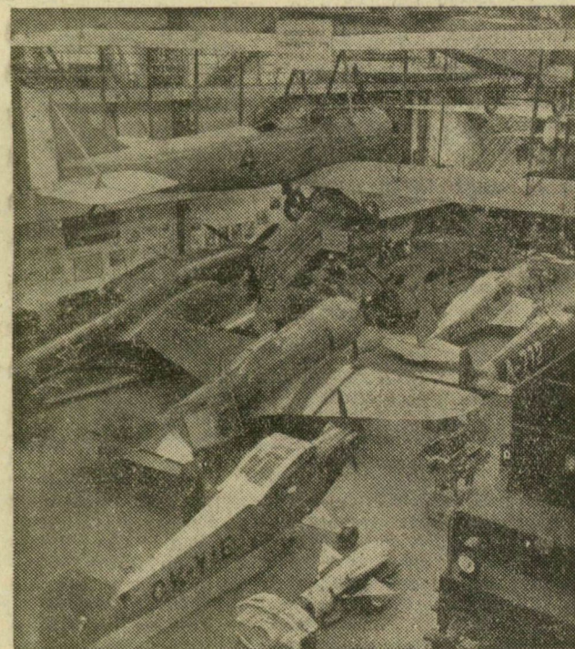
Ez a sok repülő hogyan került így egymás mellé? — csodálkozhat az olvasó. Eláruljuk. A prágai technikai Nemzeti Múzeum repülőgépkiállításán fogadja ez az érdekes kép a látogatót.

A szövetkezet takarékosági tervében éves szinten 70 ezer forint megtakarítást kalkuláltak ki a vezetők és a tagok. Az első féléves eredmény azonban ennél is jobb évvégi eredményeket sejtet — hiszen az első fél évben már 54 ezer forintot takarítottak meg az anyag, szállítási, bér- és egyéb költségeken. A takarékoskodás szép összeggel emeli a szövetkezet nyereségét is. Az első fél évben 0,6 százalékkal több nyeresége volt a KTSZ-nek, mint tavaly ebben az időszakban és ez 38 ezer forintot tesz ki. Bár ennek az összegnek jelentős részét a nagyobb tervteljesítés adja, de tényleges szerepe van a takarékosagnak is.