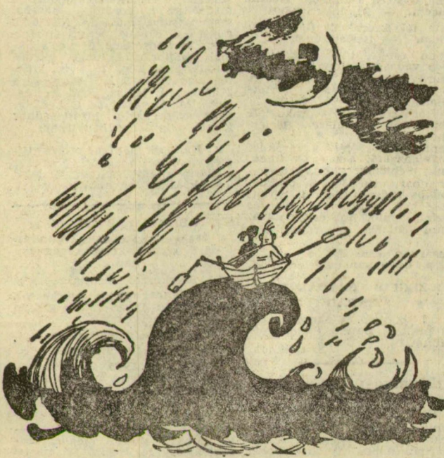
(Szánthó Imi rajza)