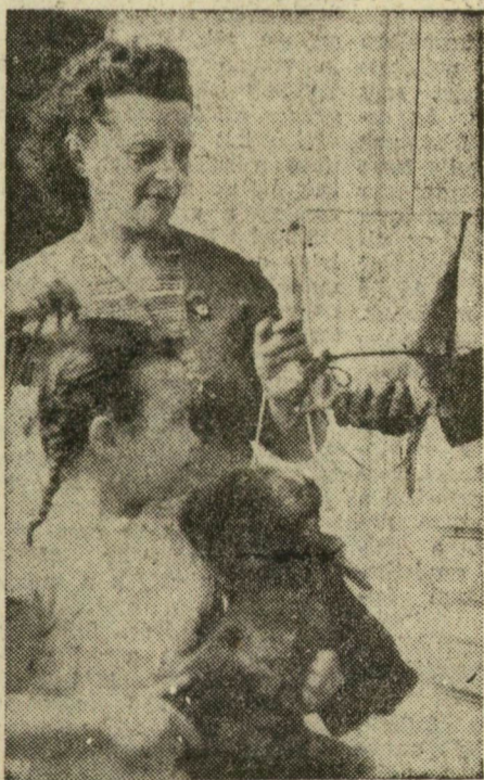
Egy a sok béketarisznya közül, amelyeket az V. Magyar Békekongresszus szegedi küldötteinek adtak át.

együttesen beszéljék meg a békeharc további feladatait és megválasszák városunk küldötteit az V. Magyar Békekongresszusra.