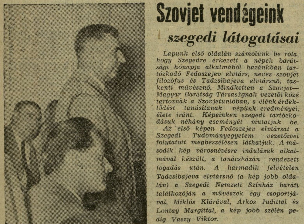
Szovjet vendégeink szegedi látogatásai

A hatalmas energiát követel a nagy cél, az pedig csak hatalmas eszközök alkalmazásával születik. Ilyen energia nem születethet egyéni terror, szabotázs és hasonló eszközök útján. A munkásosztály a nyílt osztályharc útján megy, s menetközben, a helyzettől függően, kénytelen különböző módszerekhez folyamodni, de ez egyáltalán nem jelenti azt, hogy a jezsuita állásponton, »a cél szentesíti az eszközt« elvén vagyunk. Ilyen módon hamis a revizionistáknak az az állítása, hogy mi eszerint járunk el. A mi célunk a kommunizmus, az pedig hatalmas embertömegek mozgalma, s éppen ebben a világméretű mozgalomban jelenkezik leginkább a humanizmus — nem a kiválasztottak, hanem a néptömegek humanizmus.