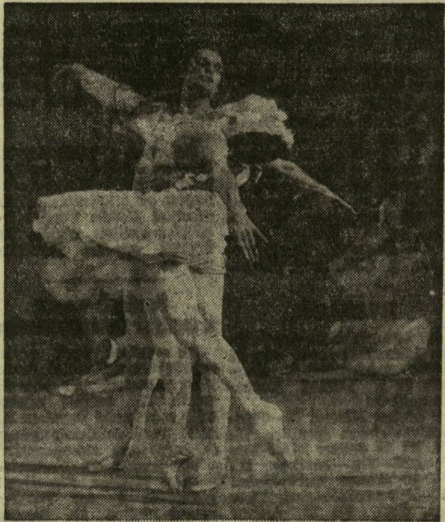
Szófiában, az Állami Operaházban nagy sikerrel mutatják be Csajkovszkij Hattyúk tava című balettjét. Képünk a Hattyúk tava egyik jelenetéről készült

Az ilyen és ehhez hasonló tervek megvalósítása nem csoda, ha izgatja a falu szervezetén kívüli fiataljait, s időről időre egyre többen kéri felvételüket a KISZ-be.